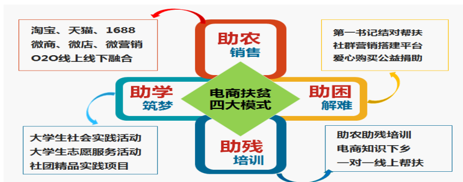
图 4 南宁职业技术学院电商扶贫“四大模式”

发展新方向，充分发挥师生的电子商务和网络营销技术优势，大胆创新教育教学模式，与贫困地区企业、地方政府机构、第一书记等组织紧密合作，积极开展产业扶贫和教育扶贫工作。经过近三年的探索，该院初步确立了电商扶贫“四大模式”，铸就了电子商务等一批社会服务明星专业，面向贫困户、农村积极青年开展就业创业培训，受益 3600 人，经济效益 10 万元，决战水果季受益 600 人，销售额 300 万元，获得省厅级 12 项研究课题，形成了良好的社会效应，取得专业建设与精准扶贫工作双丰收。