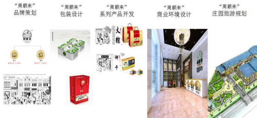
图 3 打包式服务模式