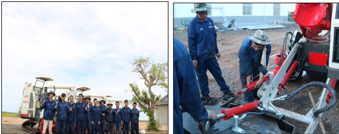
图 5 学生在广西恒宝丰农业发展有限公司柬埔寨分公司实习 (三) 推进中国标准国际输出。

广西高职院校发挥各自办学优势和特色，积极推动中国技术标准向海外输出，为提升中国职业教育的国际影响力做出了应有贡献。2018 年，广西高职院校专任教师赴国境外指导和开展培训时间达 3152 人日，开发并获得国境外采用的课程标准 59 个，开发并获得国境外采用的专业教学标准 12 个。