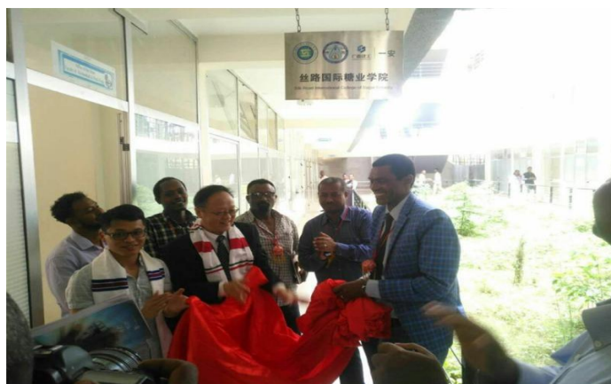
图 4 丝路国际糖业学院揭牌仪式

9月25日由广西工业职业技术学院、广西建工第一安装公司、埃塞俄比亚阿尔巴门齐大学合作共建的“丝路国际糖业学院”在阿尔巴门齐大学揭牌。推动中国制糖企业的岗位技能要求和标准国际输出，推进“国际糖业产教融合联盟”建设。